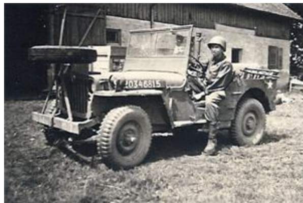
Zeitgenössisches Foto eines amerikanischen Jeeps