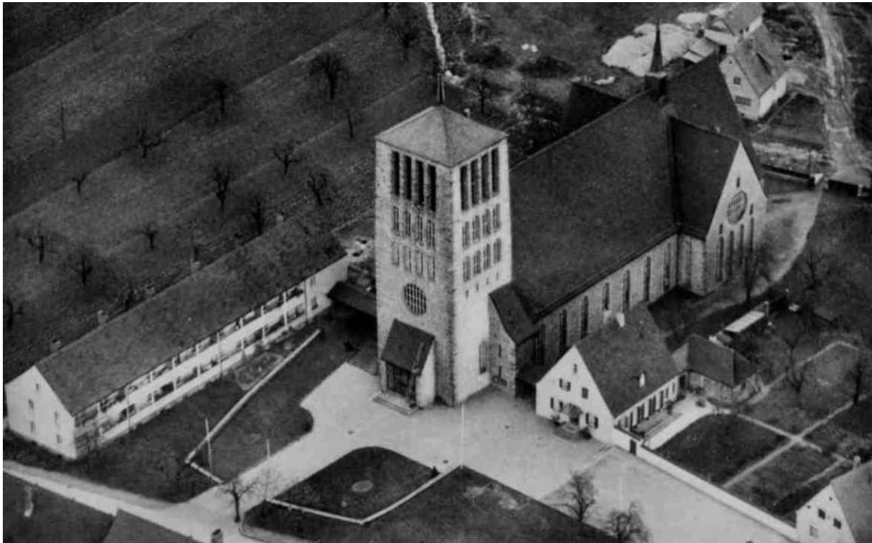
Die neue Pfarrkirche, das neue Pfarrhaus und die sechs Wohnhäuser des Sankt-Brunowerkes. Jeweils zwei Familien wohnten in einem Haus. Die heutige Goethestraße gab es noch nicht.