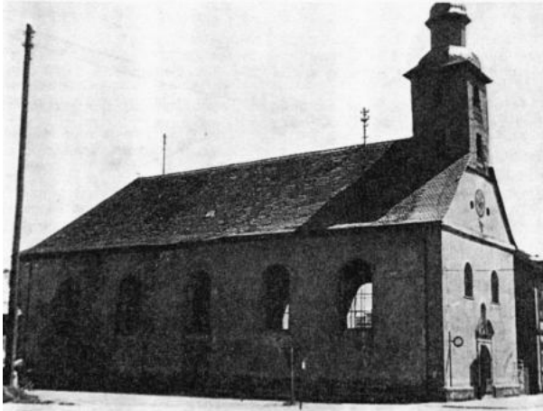
Die damalige Pfarrkirche nach ersten Instandsetzungsarbeiten.

Auch das Institut der Englischen Fräuleins, der Marienhof, erlitt einen Totalschaden. Das Feuerwehrhaus konnte nicht mehr als solches genutzt werden. Die Pfarrkirche (heute Musikschule) wurde schwer beschädigt. Sieben Wochen lang fand der Gottesdienst der katholischen Pfarrgemeinde im Kindergarten statt.