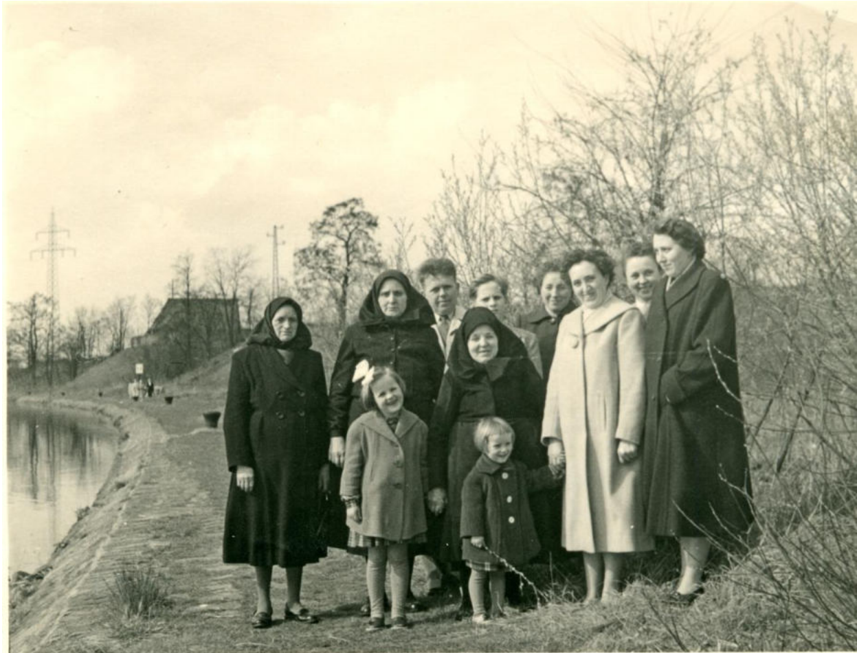
Spaziergang am Main von Heimatvertriebenen teilweise in heimatlicher Tracht, 1957

Zum 31.12.1962 verzeichnete die Gemeinde 668 Flüchtlinge. Im Jahr 1962 waren noch 45 Personen gekommen und im gleichen Jahr hatten 33 Flüchtlinge Kleinostheim wieder verlassen. Eine letzte, leider nicht datierte Liste registriert 707 Personen mit Namen, Geburtsdatum, Geburtsort und Anschrift.