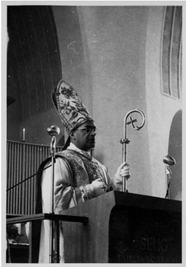
Julius Döpfner * 26.08.1913 + 24.07.1976, Bischof von Würzburg 1948- 1957, Kardinal 1958