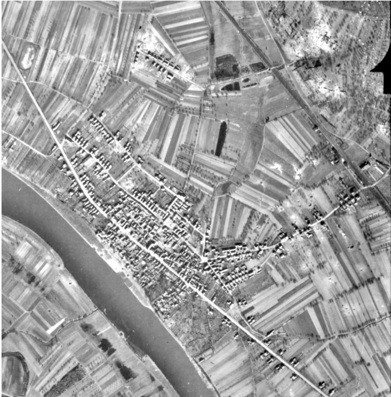
Zahlreiche Bombentrichter sind bei der Nahaufnahme unseres Ortes zu sehen (Originalaufnahme vom Heimat- und Geschichtsverein Kleinostheim)

Erwähnenswert sind außerdem noch die erheblichen Schäden an Geschäftseinrichtungen, Hausrat-, Wohnungseinrichtungs- und Wertgegenständen, die allein auf mehrere Millionen Mark geschätzt werden. Der Wiederaufbau war schwierig. Vor allen Dingen die Materialbeschaffung war mit großen Problemen verbunden.