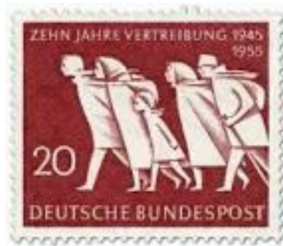
1955 gab die Bundespost diese Briefmarke zum Thema „10 Jahre Vertreibung“ heraus.

In den Jahren 1952 und 1953 schickte die Gemeindeverwaltung mehrfach Meldungen an das Landratsamt, damit erholungsbedürftige Kinder und Frauen in verschiedene Erholungsheime geschickt werden.