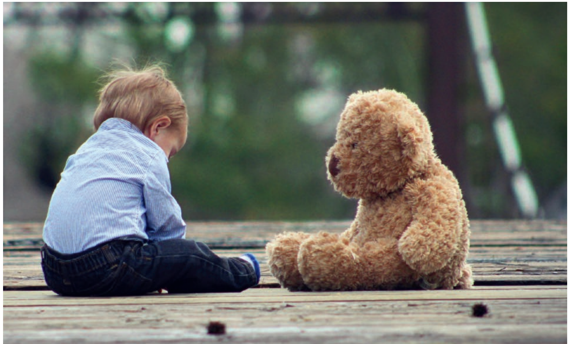
Freunde

Es können Menschen sein, die ich nur alle paar Wochen beim Friseur sehe, oder mit jenen, mit denen ich nur einmal im Monat telefoniere. Arbeitskollegen, mit denen ich privat kaum Kontakt habe. Natürlich auch Menschen, die mir täglich sehr nahe sind, wie z. B. der Partner oder die Eltern, aus deren Gesprächen ich gestärkt und frohen Mutes gehe.